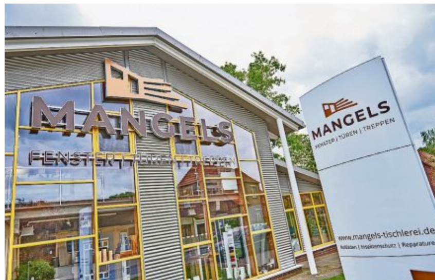
Die Tischlerei Mangels -Fenster, Türen, Treppen- in Ostertimke blickt auf eine lange Firmengeschichte, das neue Logo führt diese drei Bereiche auch optisch zusammen.

Tischlerei Mangels geht mit neuem Auftritt ins 90. Jubiläumsjahr