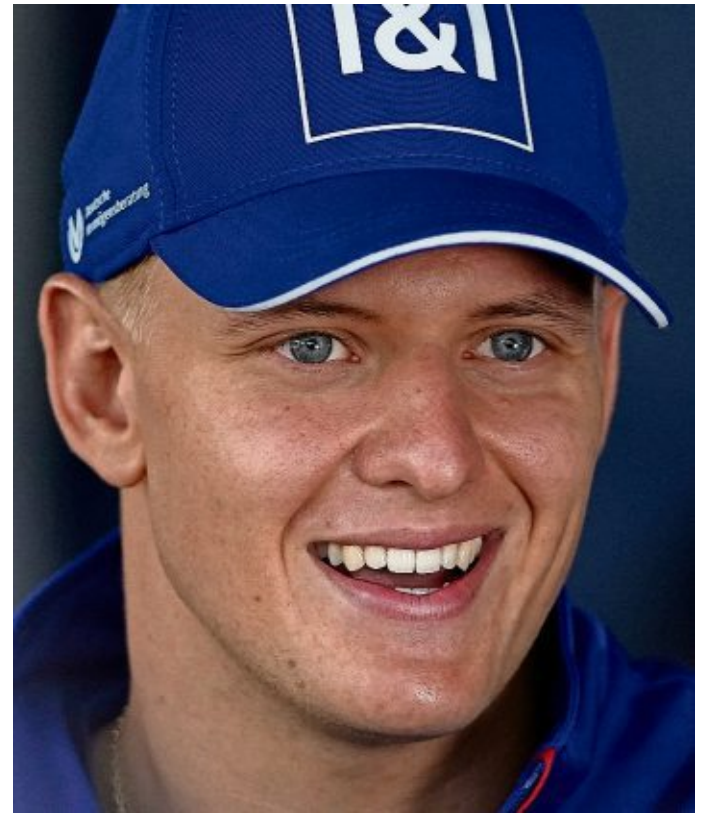
Würde sich auch in Spielberg Regen beim Rennen wünschen: Formel-1-Pilot Mick Schumacher.

Der Kurs liegt etwa 670 Meter über dem Meeresspiegel. Das heißt auch, dass es für die Bremsen und den Motor wieder noch ein bisschen herausfordernder wird. Vor allem, weil der Kurs so kurz und so schnell ist. Bei knapp 63 Sekunden steht der Rundenrekord auf der 4,138 Kilometer langen Strecke. Das Problem ist, dass dadurch kaum Zeit zum Abkühlen der besonders beanspruchten Teile bleibt. Das Rennen findet heute um 15 Uhr statt. (DPA)